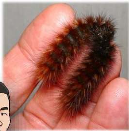
セスジヒトリの幼虫 ▲ 今年は何んな昆虫に会えるかな？