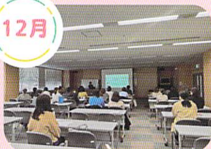
勉強会 (特性・進路・就労・福祉等 気になる事が学べます)