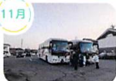
親子研修旅行 (日帰り旅行)