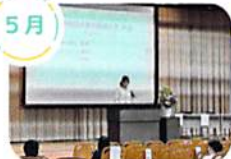
総会・記念講演 (裏面に詳細あり)