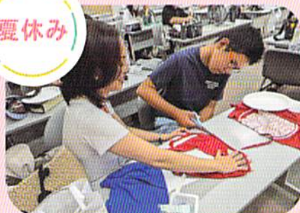
親子工作教室・親子社会見学 親と教師の懇談会