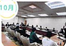
倉敷市 教育委員会との話し合い (保護者の要望を届けます)