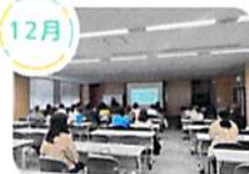
勉強会 (特性・進路・就労・ 福祉等 気になる事が 学べます)