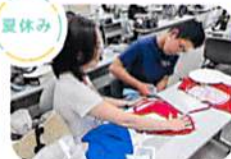
親子工作教室 親子社会見学 親と教師の懇談会