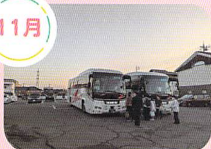
親子研修旅行 (日帰り旅行)