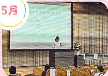
総会・記念講演 (裏面に詳細あり)