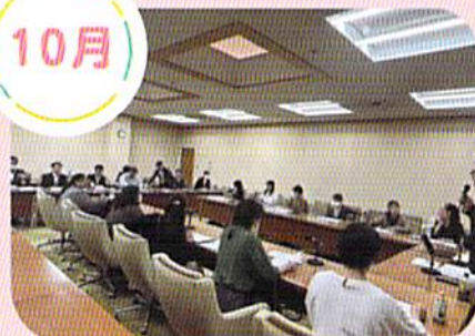
倉敷市教育委員会との話し合い (保護者の要望を届けます)