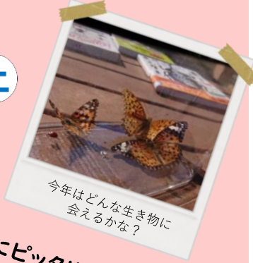
今年はどうな生き物に 会えるかな？